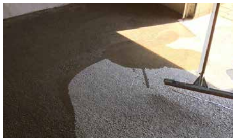
Applikation mit Gummibesen